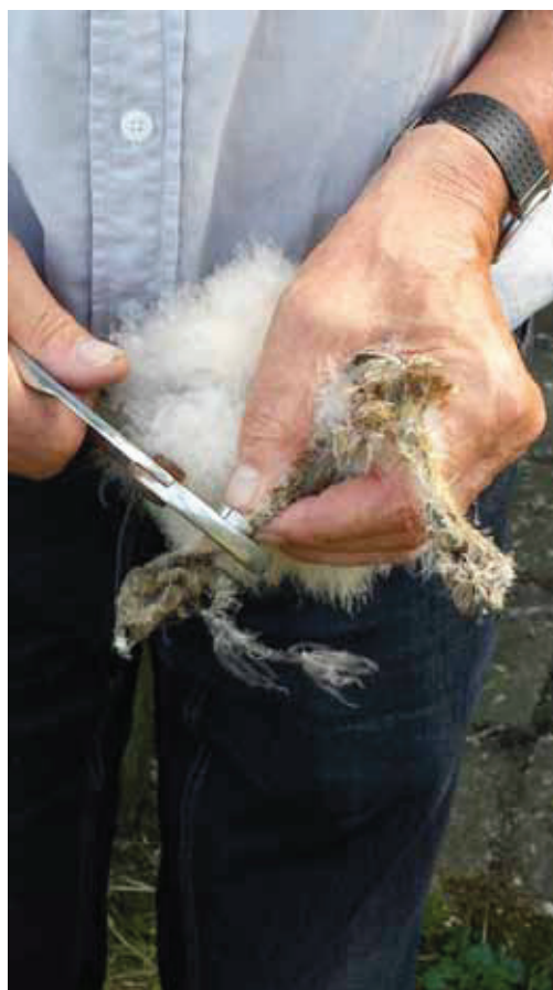
Het ringen van een jonge Kerkuil

- Op 18-5-2012 is in Wesepe een Steenuil als nestjong geringd en op 20-5-2016 broedend op 4 eieren aangetroffen in een nestkast in Diepenveen. De Steenuil heeft 5km afstand afgelegd.