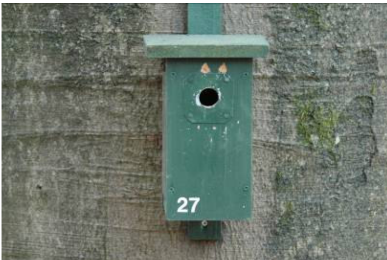
Nestkast aangepikt door specht?