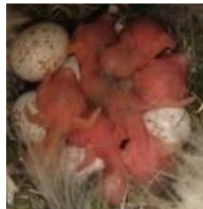
nestkast Nr. 21 14-06-2011