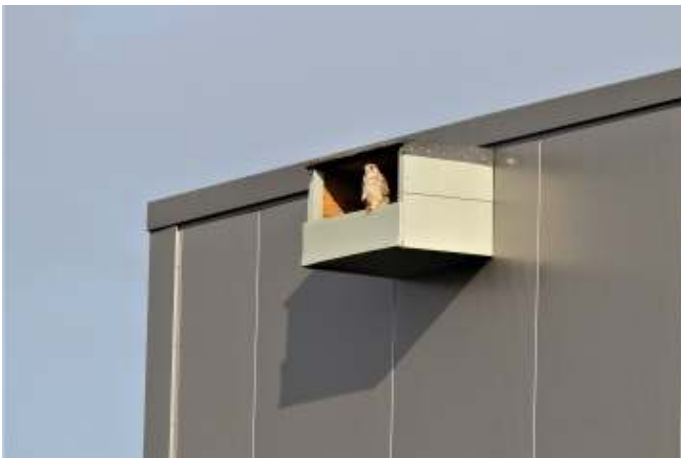
Torenavalk in kast