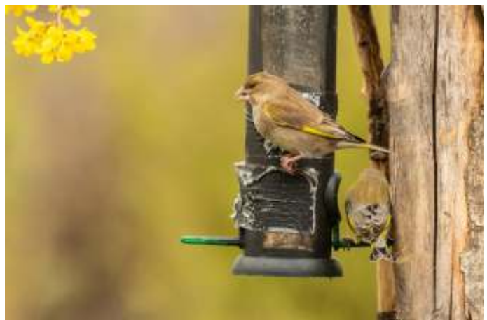
Groenling op feeder.