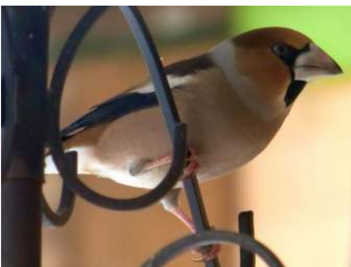
Appelvink man winterkleed

Ook bij de Appelvink zijn de verschillen opvallend.