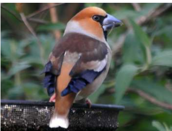
Appelvink man zomerkleed

Natuurlijk is het spannend of de overwinteraars al dan niet weer vertrokken zijn voor ze op hun mooist zijn. Zoals de Keep. Het vrouwtje, vaag bruin en oranje, krijgt wat intensere kleuren. Het mannetje verandert spectaculair: van vaag grijs en oranje naar een zomerkleed met oranje borst en gitzwarte kop en rug.