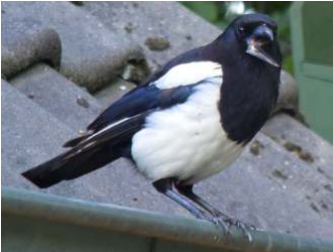
Ekster met afgebroken snavel

Over één van mijn tuinvogels maak ik me wel wat zorgen: "mijn" Ekster met gebroken snavel. Ik zag hem of haar begin juni voor het eerst, zijn ondersnavel is vlak bij de snavelaanzet afgebroken maar hangt er nog steeds wel aan, naar links en omlaag wijzend in plaats van recht naar voren.