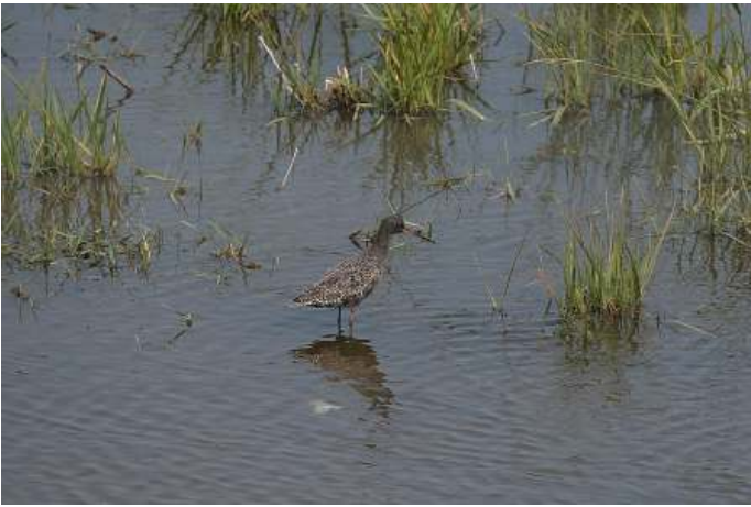
Zwarte ruiter.