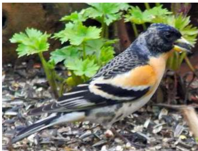
Keep man onvoltooid zomerkleed