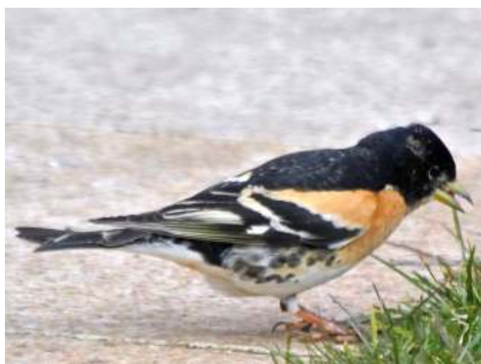
Keep man voltooid zomerkleed