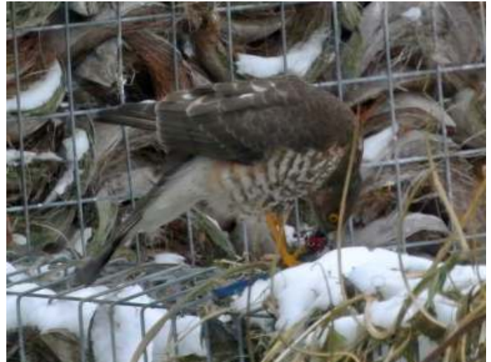
Sperwervrouw eet Pimpelmeesje

De winter is in de vogelwereld een minder saai seizoen dan in de plantenwereld, zeker voor de tuinvogelaar. Er is wisseling van de wacht door de vogeltrek en als de bomen en planten hun blad verloren hebben kun je de vogels ook beter zien. Door mogelijke voedsel-schaarste zullen meer vogels de bewoonde wereld opzoeken. Hier profiteren niet alleen tuinvogelaars van maar ook roofvogels zoals deze Sperwer die een Pimpelmees verschalkt.