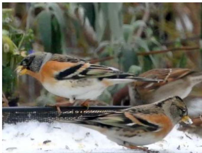
Keep koppeltje winterkleed

Natuurlijk is het spannend of de overwinteraars al dan niet weer vertrokken zijn voor ze op hun mooist zijn. Zoals de Keep. Het vrouwtje, vaag bruin en oranje, krijgt wat intensere kleuren. Het mannetje verandert spectaculair: van vaag grijs en oranje naar een zomerkleed met oranje borst en gitzwarte kop en rug.