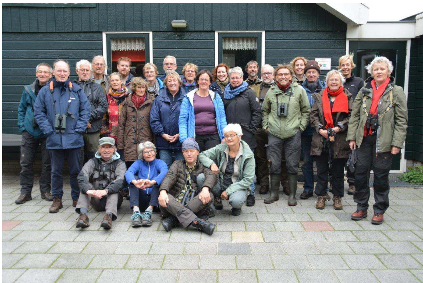
Groepsfoto alle deelnemers Texel weekend.