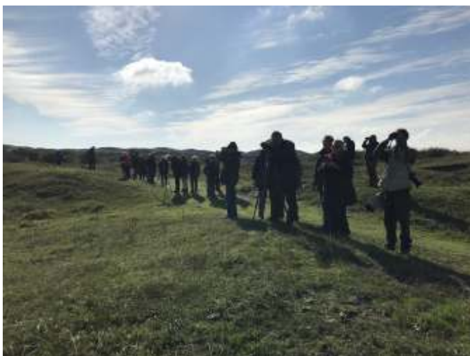
Aantal vogelaars.