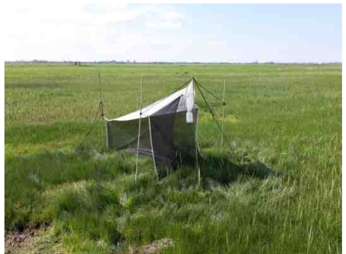
Malaiseval voor het vangen van insecten (foto Nick Hofland, Radboud Universiteit).