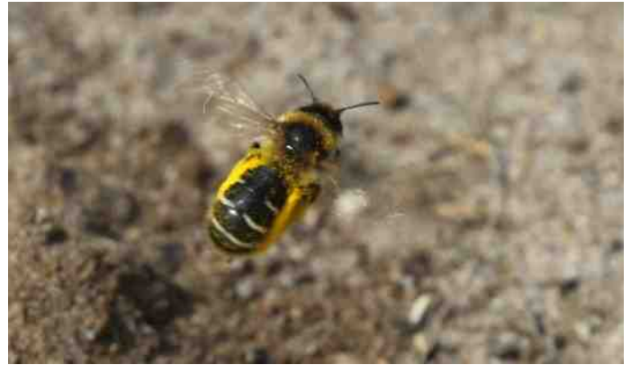
Pluimvoetbij, één van de wilde bijensoorten waarvan bekend is dat ze sterk in aantal achteruitgaan.

Het onderzoek is gestart in 2016 en wordt in 2018 afgerond. Er wordt gekeken naar het broedresultaat van spreeuwen en boerenzwaluwen. In de buurt van een gebied met minstens vijf bezette nesten worden met vallen insecten gevangen. Verder wordt het broedresultaat van de nesten bepaald, worden dieetmonsters genomen (door een ring in het keeltje van de nestjong te plaatsen en na enkele uren de prooien te verzamelen) en worden biometrische gegevens verzameld (gewicht jongen, vleugellengte). Vogels worden geringd en het aantal vervolglegels wordt bepaald. Ook worden er watermonsters genomen en wordt met filmopnames de voederfrequentie bepaald. Voor dit onderzoek worden vrijwilligers in-