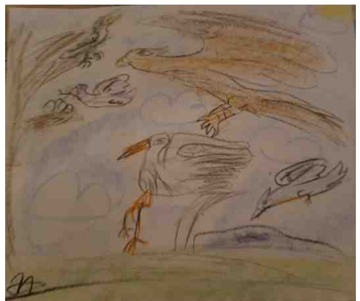
Tekening gemaakt door Myrthe Wennekes