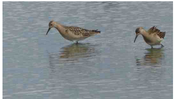
Kemphaan juveniel.

Na een kop koffie reden we naar de haven 'om Steenlopers te gaan kijken'. En ja hoor, die zaten weer op de aanlegsteiger. De meesten in winterkleed. Jonge Visdieven vroegen om voedsel. Goed idee, eten! Het was al half een, op naar het visrestaurant en naar de kibbeling (voor de meesten van ons). Omdat er op een steenworp afstand een Draaihals was gezien, zijn we daar heengereden. Helaas, geen Draaihals. De pogingen van enkele dames om opvallend met hun hals te draaien werd niet opgemerkt. Tenslotte reden we naar Ezumakeeg. Op het bouwland een hele grote groep Goudplevieren. Net toen viel er een spat regen. Geluk dus, voor de rest bleef het droog en zonnig. Bij Ezumakeeg hadden we prachtig licht van achter ons waardoor de vogels schitterend uitgelicht werden. De wind hadden we ook in de rug: alles zat mee dus. Enorme aantallen Kluten, Goudplevieren, Kieviten, Kleine strandlopers, Watersnippen, Bontbekstrandlopers en Kemphanen met alle kleuren poten, snavels en verenkleed. Natuurlijk waren er ook vogels in minder grote aantallen: Grote sterns, Reuzensterren, Krombekstrandlopers, Bruine kiek, Buizerd en Bonte strandlopers. Het is geen uitputtende opsomming, ik geef een indruk van de dag. We zagen in totaal 81 soorten vandaag.