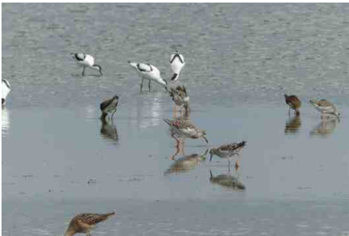
Kemphanen en Kluten.

We vertrokken met 11 mensen inclusief een introducee om 7.15 uur. Bij Zoutkamp pikten we nummer 12 op. Op het moment dat we bij de Lauwersmeer aankamen, zagen we direct een Visarend die voor onze ogen een visje scoorde. Een goed begin! De Slechtvalk zat potdorrie niet op zijn vaste paal! Bij de vogelkijkhut van Jaap Deen zaten veel vogels op het water waaronder heel veel Brandganzen, Grauwe ganzen, Wilde eenden en Lepelaars. Hier en daar gelaardeerd met Casarca's, Kieviten, een enkele Kemphaan en andere eenden. De Slechtvalk zat op een klein hekje en even later zat hij op de grond te midden van een bult witte veren. Alsof hij een dons-kussen had stukgepikt. Stefan zag "een Houtsnip, nee een goudsnip..... uhhh, ik bedoel een Watersnip!" Vlak voor de hut kregen we een peepshow van een Watersnip. Deze ging zich in een prachtig licht zitten wassen en poetsen. Nog nooit zo mooi een Watersnip gezien!