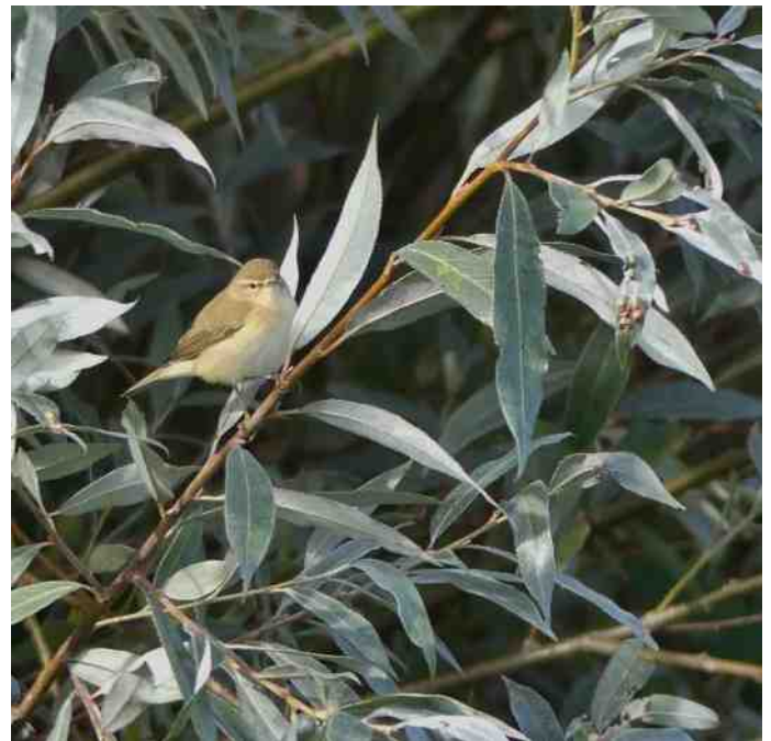
Tjiftjaf.