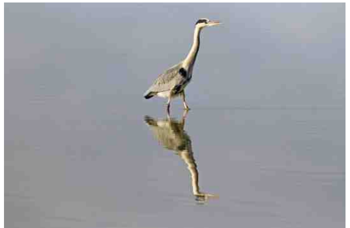
Blauwe reiger.