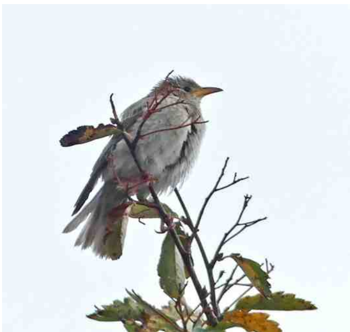
Roze Spreeuw.