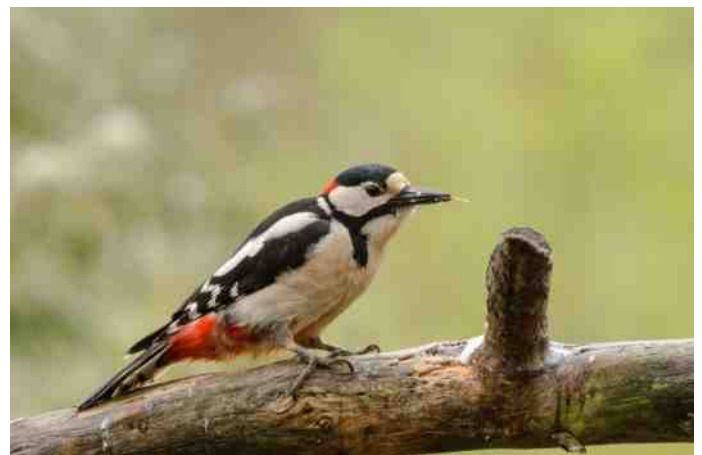
Grote bonte specht.

Zo gevoelig als de tong is, zo hard is de slag met de snavel. Een gevangen Ivoorsnavelspecht had eens binnen een uur een vuistgroot gat in een stenen muur weten te bikken.