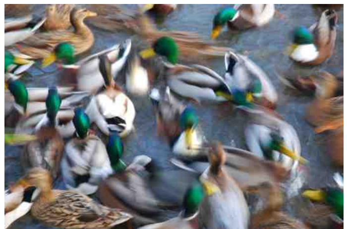
Artiestiek beeld van wilde eenden.