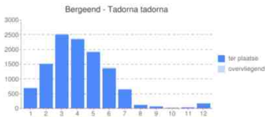
Grafiek 1: Voorkomen Bergeend per maand in Midden-IJsselgebied

trekgroepen adulten langs de IJssel, tot maximaal 50 exemplaren (18 juni 2014, Welsummerwaard). Ouders met jongen blijven wat langer, maar in de loop van juli worden de laatste juvenielen definitief aan hun lot overgelaten. Deze blijven vervolgens nog enige tijd in de broedgebieden hangen maar vanaf september trekken ook zij geleidelijk weg. De laatste "diehards" zijn nog te zien tot in oktober. Oktober is de maand met de geringste kans op het waarnemen van een Bergeend. Vanaf eind november/begin december trekken de aantallen voorzichtig aan als de eerste broedvogels weer verschijnen.