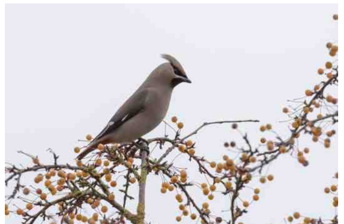
De laatste weken is een ware invasie gaande van Pestvogels.