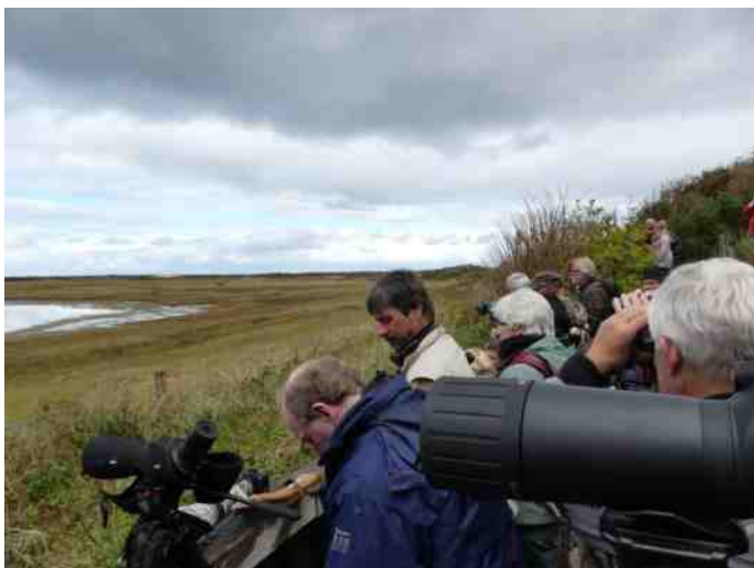
Enige deelnemers.

ze niet meer. Wij zaten ondertussen lekker aan de koffie en warme chocomel, al dan niet met appelgebak en slagroom. Op de camping werd geluncht, ingepakt en afgerekend, waarna we naar De Cocksdorp vertrokken om de juveniele Roze Spreeuw midden in het dorp tussen "gewone" Spreeuwen, van de vele besjes te zien eten. In het fascinerende gebied De Sluffer waren heel wat steltlopers te zien: o.a. Kanoeeten, Rosse Grutto's, Bonte Strandlopers en Bontbekplevieren. Ook werden we hier nog verblijd met een show van de Blauwe Kiekendief. Via de IJzeren Kaap, waar we naast vele vogels ook solex rijders te zien kregen, gingen we naar de boot, die al weer voor ons klaar lag en min of meer direct vertrok. Na een voorspoedige reis waren we om ongeveer half zeven weer bij de verzamelplaats in Deventer. Het vogeltootaal komt op ongeveer 103 soorten.