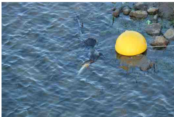
Aalscholver gestikt in te grote vis; Bolwerksplas

Maar vaak gaat het ze ook gewoon om de "liefde voor eigen maag", een dikke vette vis laat je niet zomaar gaan. Als vogel weet je maar nooit of je de volgende dag voldoende te eten krijgt. En wat binnen is is binnen, dus beter snel de hele vis naar binnen werken, dan in kleine hapjes, want voor je het weet komt er concurrentie. Daarbij gaat het wel eens mis en stikt de vogel in zijn eigen schrokkerigheid. Foto 1 toont zo'n fataal geval van gulzigheid.