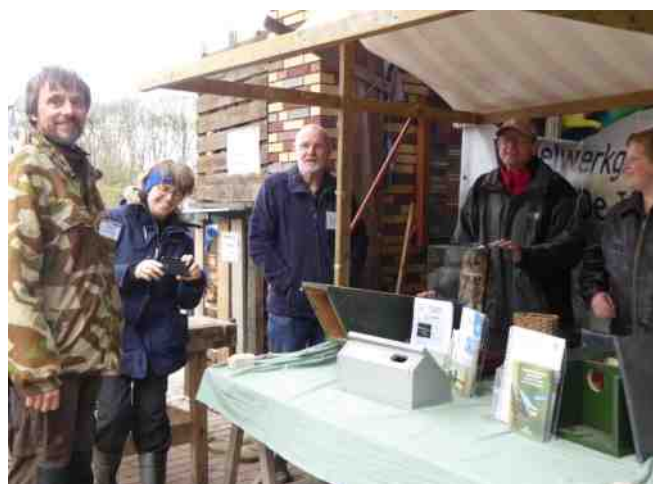
De Junior Vogelclub helpt in de kraam tijdens de Jonge Dierendag op de Ulebelt.