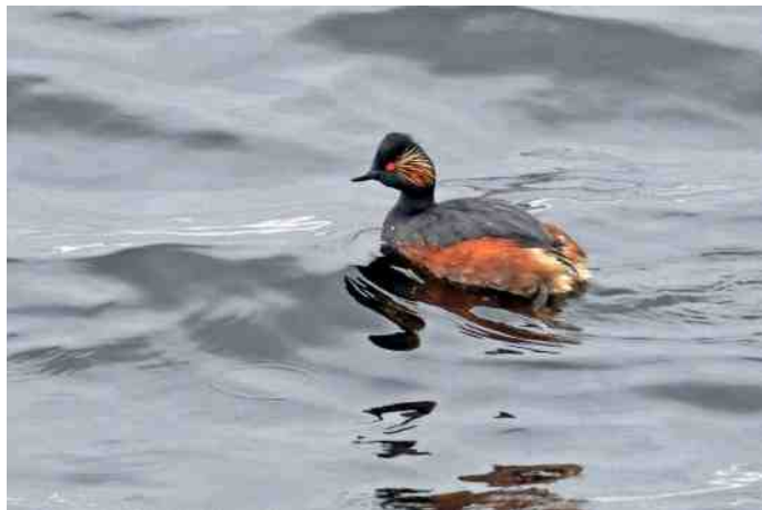
Geoorde Fuut.

Verder dan maar, naar Scheerwolde, waar een waar festijn van watervogels ons in het laag- en hoogveen verwelkomt. We genieten van de Oeverwaluwen in de wand met een gedicht van de Dichter van Overijssel, Geoorde futen (oh, wat mooi!) en Gele kwikstaarten. Vergeet echter de Regenwulp niet, die in dit gebied thuishoort en zich door ons laat ontdekken.