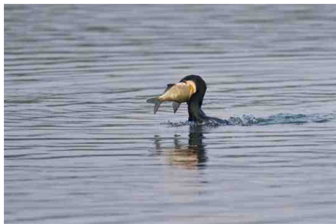
Aalscholver met te grote vis zwemt met moeite naar de oever; Duursche Waarden

Een ander mooi voorbeeld van gulzigheid zag ik op 20 februari bij de Bolwerksmolen. Een Grote Mantelmeeuw stond in de ondergelopen uiterwaard te worstelen met een dikke aangespoelde paling. De meeuw moet gedacht hebben dat een paling gladjes naar binnen glijdt, maar verkeek zich toch op de lengte.....(foto 4). Uiteindelijk "won" de paling het duel postuum, werd weer uitgekotst, maar daarna alsnog in mootjes gehakt.