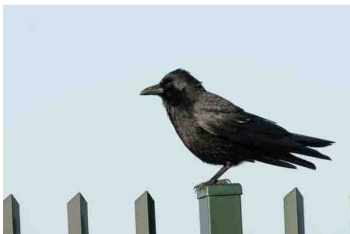
Zwarte kraai.

Uit het onderzoek bleek dat de dieren nauwelijks contacten legden met vreemde soortgenoten. Totdat de wetenschappers de dieren confronteerden met een boomstam met diepe gaten waarin keverlarven zaten.