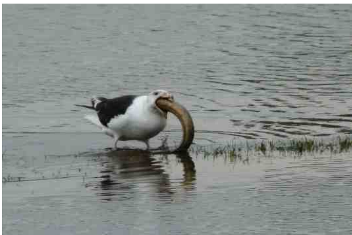
Grote Mantelmeeuw probeert een dikke paling naar binnen te werken; Bolwerksplas