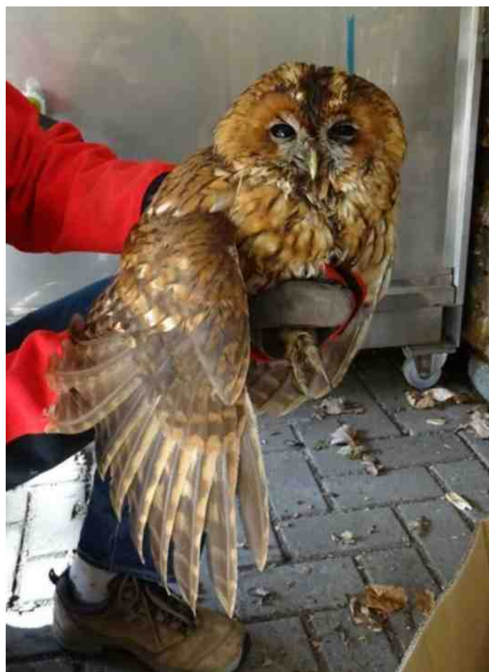
Het dier liet zich te makkelijk vangen