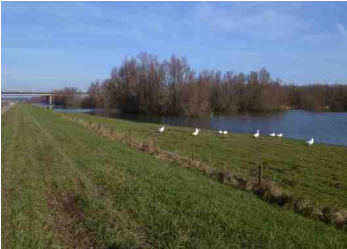
Moet het wilgenbosje bij de A1 echt helemaal weg?