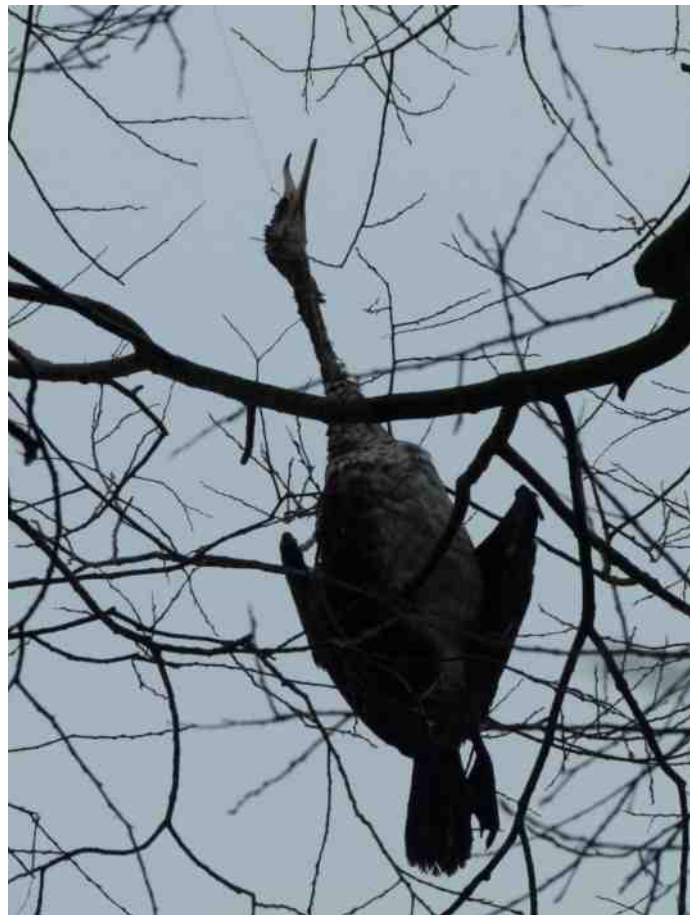
Aalscholver met vishaak en -snoer verstrikt geraakt in slaapboom; Rammelwaard

Gelukkig gaat het meestal goed. Vaak zie ik Aalscholvers na een succesvolle duik, als een vreemd soort onderzeeër waarvan je alleen de periscoop ziet, naar de kant zwemmen (zie foto 3), om daar de mega-vis alsnog naar binnen te werken en amechtig uit te gaan buiken.