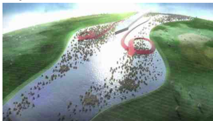
De pijlen geven aan hoe het water stroomt als vegetatie de doorstroom belemmert.

In overleg met gemeenten, eigenaren en belanghebbende instituten/verenigingen heeft bureau Courant in opdracht van RWS in de afgelopen tijd geïnventariseerd wat de natuurwaarde van alle gebieden is en waar zich (beschermde) flora en fauna bevindt/beveegt. Verder is met de belanghebbenden besproken welke groenelementen cultuurhistorische, en/of natuurwaarden hebben. Bij deze groenelementen moet met meer omzichtigheid bepaald worden wat wel/niet weg kan/moet en wat dat weer voor effect