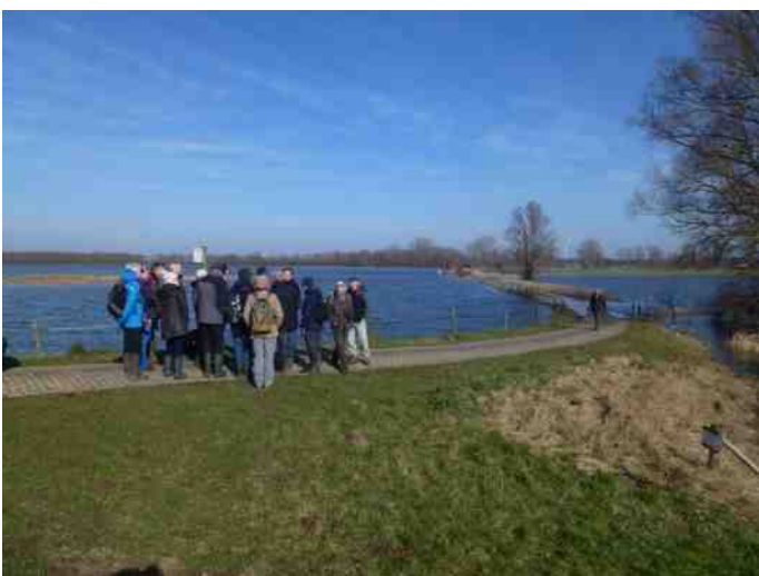
Ook na Stroomlijn zullen er in het kader van KRW nog heel wat werkzaamheden plaats vinden.

Het blijkt dat van het wilgenbos in de huidige plannen nog wel een zoom blijft bestaan omdat die voor de bever, vogels en de vleermuizen van belang is. Het achterste deel (dichtbij de IJssel) moet wel weg. Een aantal deelnemers ventileren hun ideeën over een toekomstige invulling: bijv. ophogen en zorgen voor een plas/dras-situatie voor de hier in de buurt broedende weidevogels. Ook de boeren willen wel meedenken over een nieuwe (natuur)invulling en willen ook het beheer ervan op zich nemen. Er leeft een aantal ideeën in de groep die uitgesproken worden en waar op gereageerd wordt, waarbij Xander op het