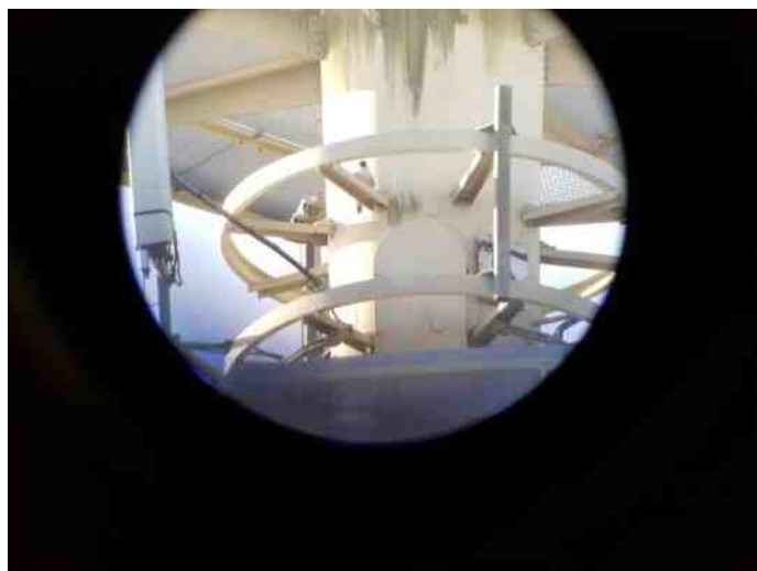
Slechtvalk gezien door een telescoopkijker

Intussen verstrijkt de tijd. Het is inmiddels 13.00 uur. Een paar van ons heeft verplichtingen elders en haakt onderweg af.