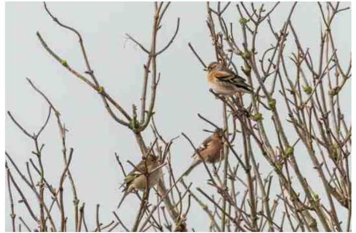
Keep en vinken

De volgende stop was de parkeerplaats met camping voor sportvissers en een benzinepompstation met sanitair: erg belangrijk. Waargenomen werden vele Kuifeenden, Krakeenden en Aalscholvers. De volgende stop was bij Den Oever, een kwelder en schorrengebied. Vanaf de dijk en de havenpier deden we vele vogelontdekkingen: meeuwen, Scholeksters, geen Steenlopers en vanaf een nieuw observatiepunt werden Bergeenden gespot en Geoorde futen. Waarneming.nl werd geraadpleegd en een bijzondere ontdekking was mogelijk, nl. de Buffelkopeend! Ten zuiden van Den Oever werd hij gespot te midden van een grote groep Kuifeenden. Baltende Futen gingen nog poseren voor fotograaf Harry Dijkerman, de nodige shots werden gemaakt. We toerden verder naar plekken voor mooie waarnemingen langs de IJsselmeerdijk maar het viel tegen wat we waarnamen. De vele kijkschermen binnendijs gaven meer succes: vele Kuifeenden en Toppers. Verder door de Wieringermeerpolder richting Hippolytushoef en ja hoor: Kramsvogels en Koperwieken lieten zich vele malen spotten, de fotografen konden aan de bak en het zonlicht stond mede garant voor mooie plaatjes. We zijn nog een keer gestopt aan de Wadkant, en