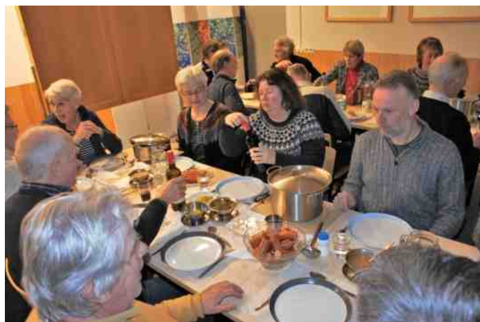
En maar wachten op het eten...

De telploeg dit jaar was 24 man groot waarvan 15 leden van de VWG. De resultaten van de tellingen