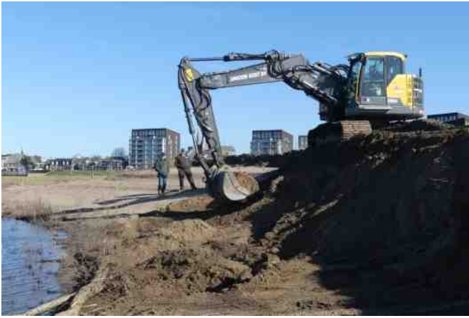
De oeverwaluwanwand aan de Bolwerksplas is op 20 maart j.l. afgestoken. De wand is nu weer gereed voor nieuwe nesten van de oeverwaluwan.