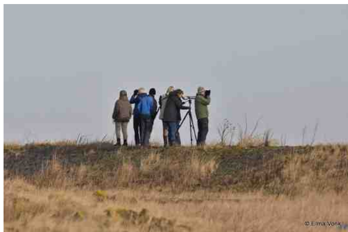
Enkele clubleden aan het vogels spotten.