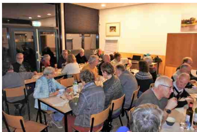
En het is alweer bijna op!

Over het algemeen was de conditie goed en lag het gewicht gemiddeld op 3.0 kilo (spreiding: 1288-3849 gram) en varieerde het aantal te ringen jongen per nest van 1 t/m 4.