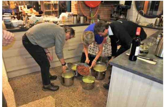
De kookploeg in actie met het bereiden van de boerenkool

Het maandelijks excursieprogramma van halve of hele dagen kende een goede deelname. In totaal waren er weer 11 excursies dit jaar. We bestrijken een flink deel van het land: van de Zuidpier tot het Lauwersmeer met daartussen de Biesbosch en de Auken. Maar ook ons werkgebied blijft mooi en er zijn